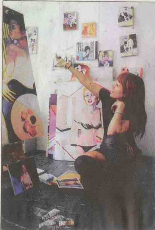
Kreativ: Die Künstlerin bei der Arbeit in ihrem Atelier.